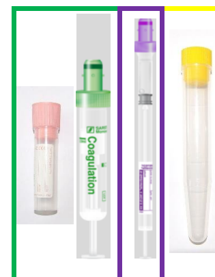
Koagulace otevřený/uzavřený systém