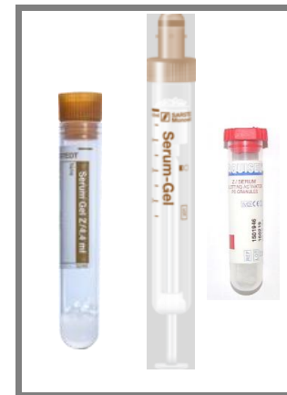
Sérum - gel otevřený/uzavřený systém