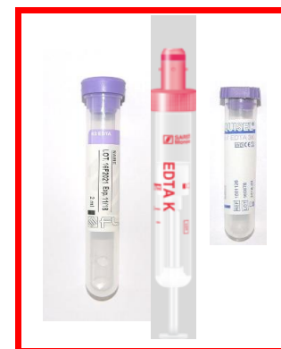
K3EDTA - krevní obraz otevřený/uzavřený systém